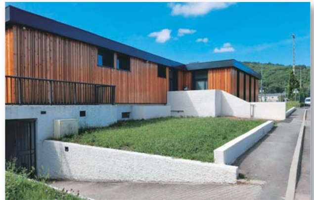
Complexe sportif Cahors

FACADES - MAÇONNERIE PIERRE ET BETONS - RESTAURATION ISOLATION PAR L'EXTERIEUR