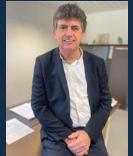
François Breil, Président de la Chambre de Métiers et de l'Artisanat du Lot